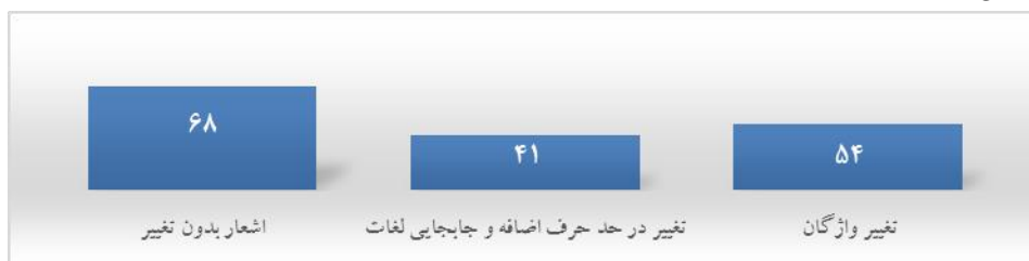
نمودار ۴: میزان تغییرات اشعار را در مقایسه با دیوان شعر شاعران

در نمودار زیر می‌توان میزان تغییرات اشعار را در مقایسه با دیوان شعر شاعران دید: