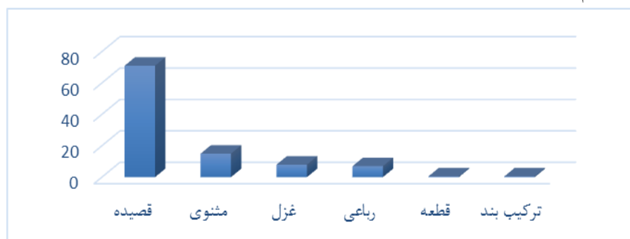
نمودار ۱: قالب‌هایی که ابیاتی از آنها در کلیده‌ودمنه تضمین شده است

نصرالله منشی در تمام داستان‌های کتاب کلیده‌ودمنه از ابیات دیگران تضمین کرده است. ارتباط شعر و نثر در این کتاب به گونه‌ای است که خواننده هیچ پرش و گسستی بین نثر و شعر تضمین شده احساس نمی کند؛ گویی تمام اثر، اعم از شعر و نثر به شکل یکپارچه و به قلم یک شخص نوشته شده است. بهره‌گیری اندک نویسنده از حروف پیوند یا ربط در ضمن به کارگیری اشعار، خود گویای پیوستگی تام و تمام شعر تضمین شده با سیاق کلام و حال و هوای متن است و از حافظه شعری گسترده نویسنده و تسلط او به سنت‌های شعری حکایت می کند. از میان بیش از ۲۴۰ بیتی که نصرالله منشی تضمین کرده، بیش از هفتاد درصد آن از میان قصاید انتخاب شده است. استفاده فراوان از قالب قصیده امری عادی است، زیرا قالب رایج شعری تا پیش از قرن هفتم بوده است.