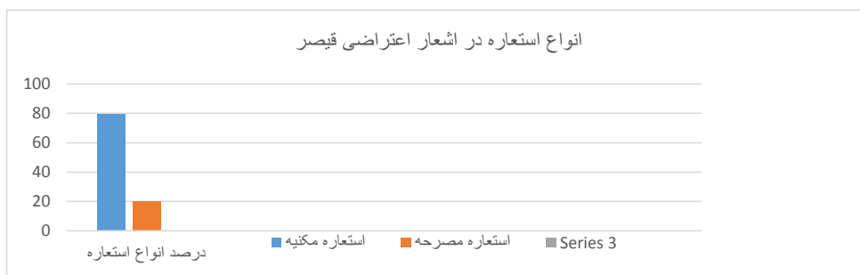
نمودار شماره (۲): انواع استعاره در اشعار اعتراضی قیصر امین پور

قیصر از انواع عناصر طبیعی در خلق انواع استعاره شعر اعتراضی خود بهره جسته است که به ترتیب بسامد عبارت‌اند از: اشیا ۴۳ بار؛ طبیعت ۲۵ بار؛ حیوانات ۲۳ بار؛ انسان ۱۵ بار و امور انتزاعی ۳ بار که در مجموع ۱۰۹ بار شده است.